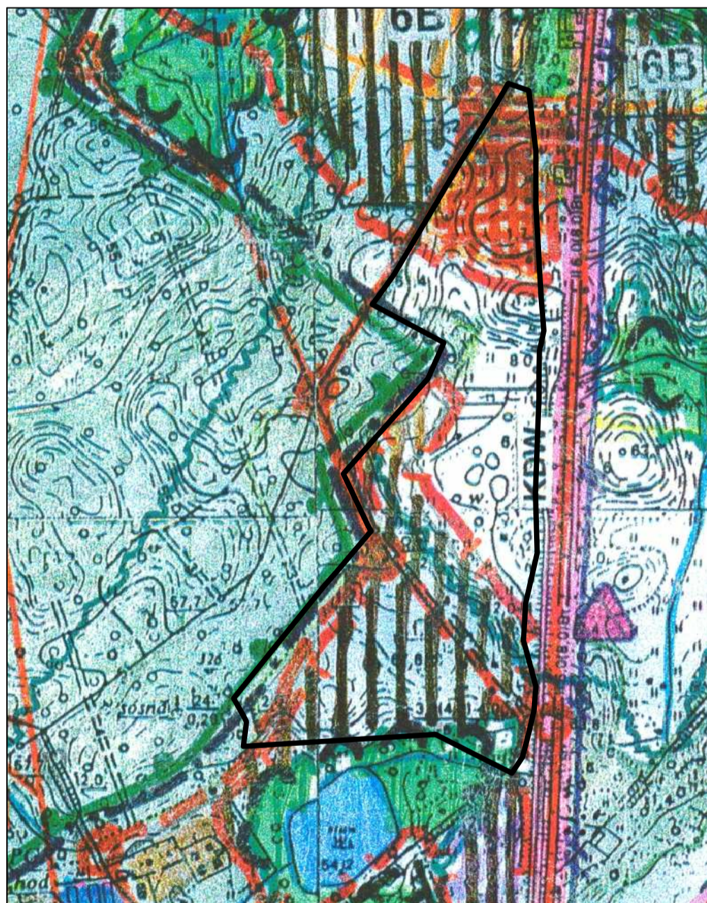
Wyrys ze Studium uwarunkowań i kierunków zagospodarowania przestrzennego Gminy Lubniewice