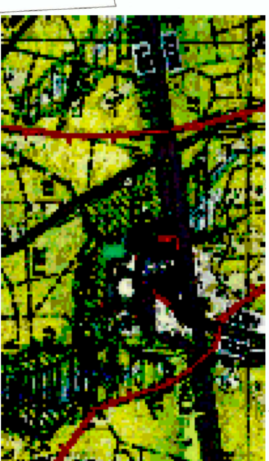
GRANICE OBSZARU OBJĘTEGO MIJSCOWYM PLANEM ZAGOSPODAROWANIA PRZESTRZENNEGO

Wyrus ze Studium uwarunkowań i kierunków zagospodarowania przestrzennego Gminy Lubniewice uchwalonego uchwałą Nr XVII/125/2000 Rady Miasta i Gminy Lubniewice z dnia 28 czerwca 2000 r. ze zm.